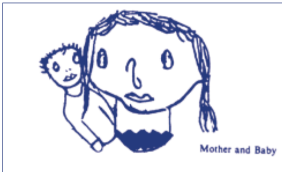
رسم أحد الطلبة الموهوبين، يعتمد الرسم على إضافة التفاصيل للخط المتعرج (أنف الأم) Fisher 2001

كما أن العديد من الاختبارات المشهورة لقياس الإبداع تعتمد على الرسومات، فمثلاً اختبار Torrance, 1962 يعطي الطالب ورقة بيضاء فيها شكل بيضاوي مبهم، ويطلب إليه زيادة التفاصيل اللازمة لهذا الشكل، ومن ثم إعطاء الشكل عنواناً ملائماً. وكذلك يطلب اختبار Torrance, 1962 من الأطفال إكمال رسم معين بالاعتماد على خطوط متعرجة أو متوازية. فيما يلي رسم يعتمد على الخطوط المتعرجة لأحد الطلاب الموهوبين.