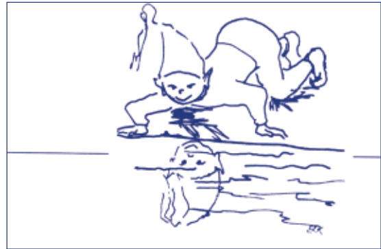
استخدام تأليف الأشئات Synectics لتحفيز التفكير الإبداعي لدى الأطفال

اكتب جميع الأسئلة التي يمكن أن تفكر بها لمعرفة ما يحدث في الصورة، ثم أذكر جميع الأسباب الممكنة التي أدت إلى حدوث ما تراه، وأذكر جميع النتائج المحتملة التي يمكن أن تترتب على ما يحدث، سواء أكانت عاجلة أم آجلة.